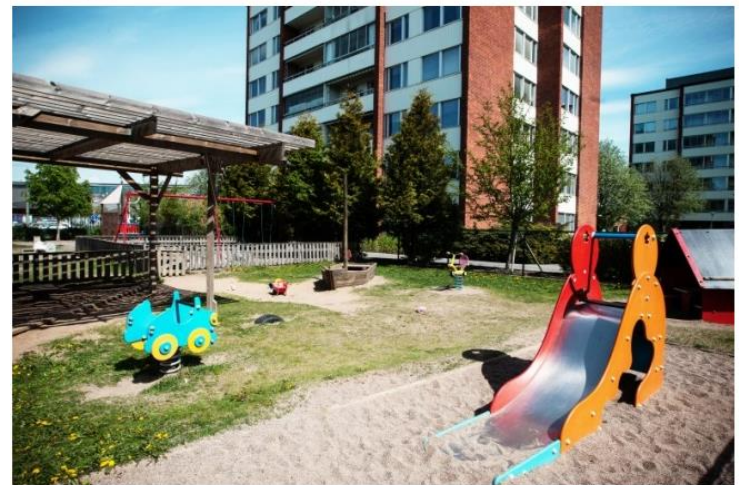
En granne som stör sig på dagisbarnens högljudda lekar har fått rätt i domstol. En ovanlig dom, anser Osteråkers kommun.